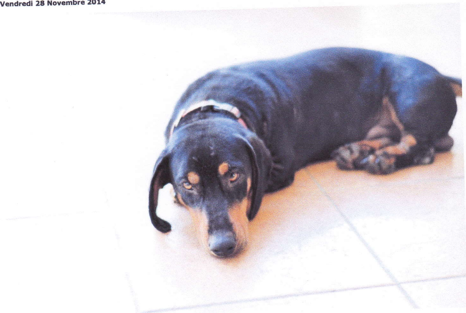
Tuki.